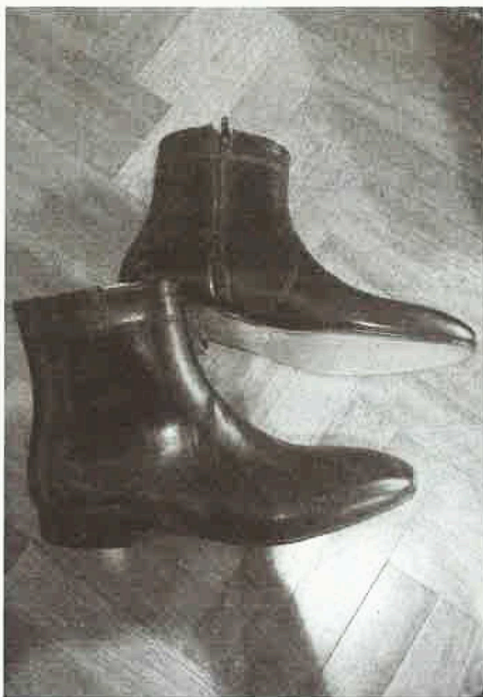
Les fameuses bottines Dylan, cultes et classes. © Carvil