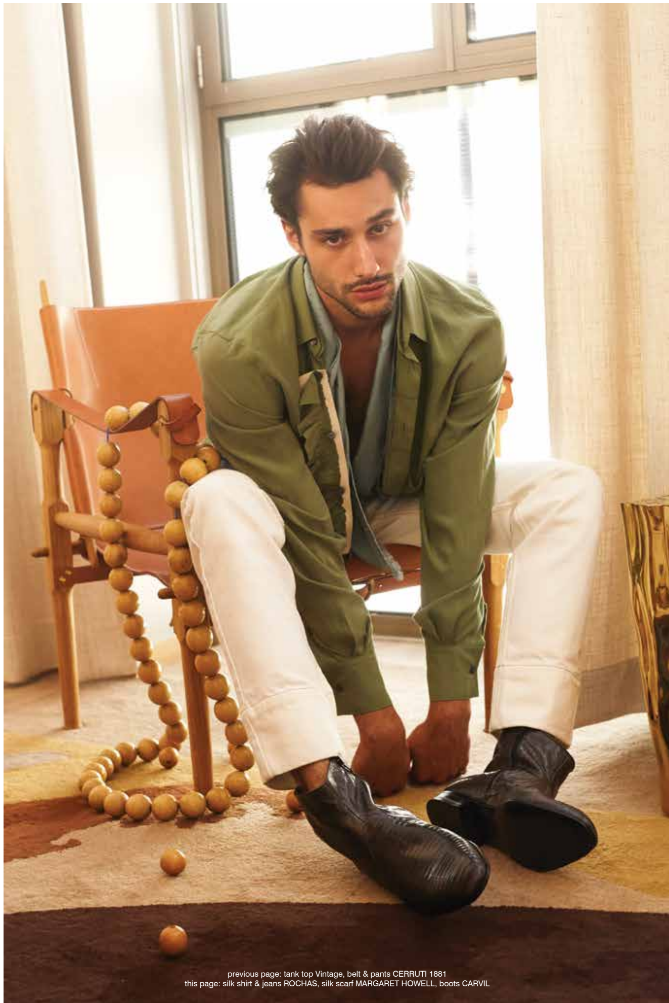
previous page: tank top Vintage, belt & pants CERRUTI 1881 this page: silk shirt & jeans ROCHAS, silk scarf MARGARET HOWELL, boots CARVIL