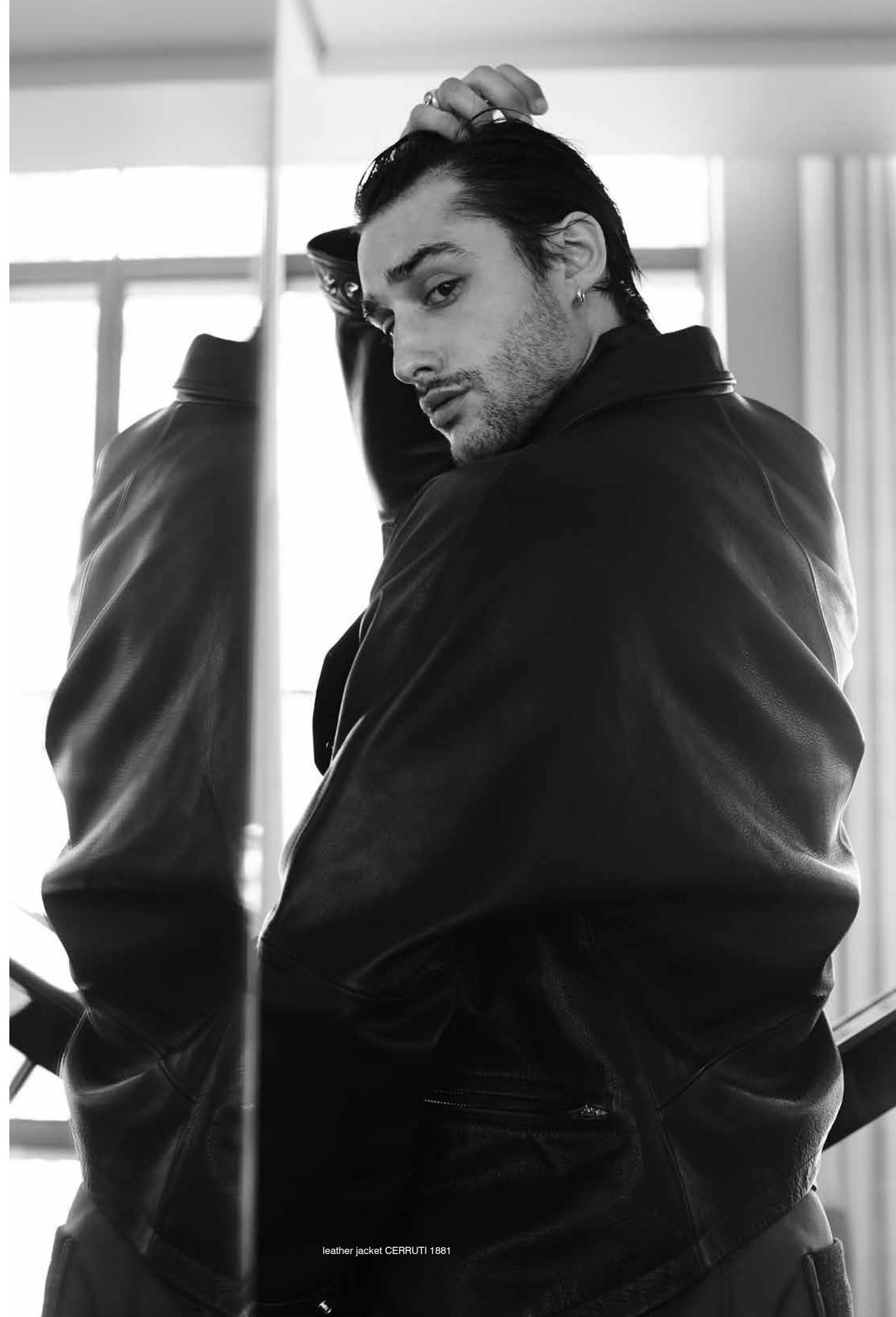
leather jacket CERRUTI 1881