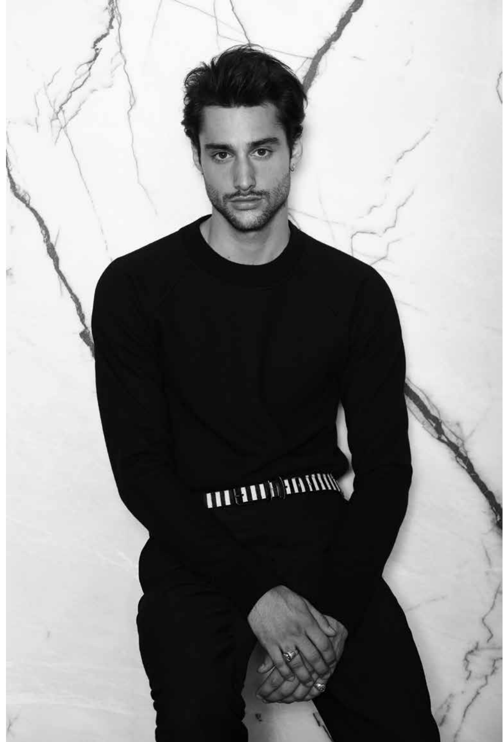
sweater MARGARET HOWELL, belt & pants CERRUTI 1881