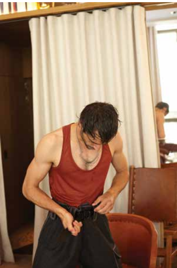
tank top Vintage, belt & pants CERRUTI 1881

Je dirais que c'est 70% de « il faut le faire », mais il reste quand même un peu de satisfaction. Ce serait terrible, sinon... Au départ, il y avait très peu de photos de moi, et on me disait : « On ne te voit pas, on a besoin de te voir ». Et j'en ai mis un peu davantage. Mais si ça ne tenait qu'à moi, et ou si je ne travaillais pas dans des milieux d'image, je pense qu'il y aurait très peu de photos de moi sur Instagram. Le reste, ce serait mes images d'inspiration.