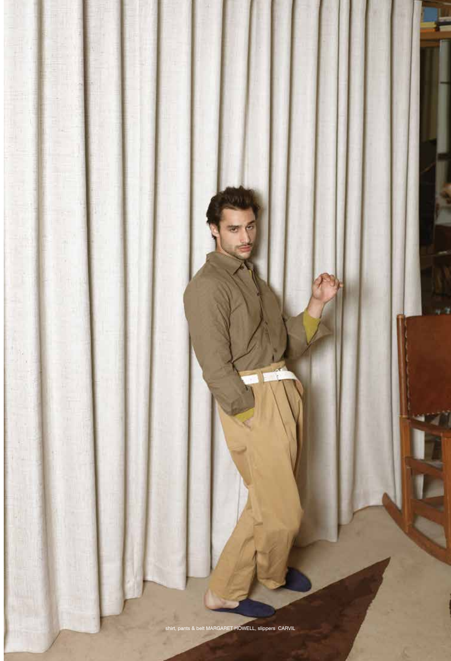
shirt, pants & belt MARGARET HOWELL, slippers CARVIL